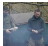
Bushcraft meeting i Hornslet